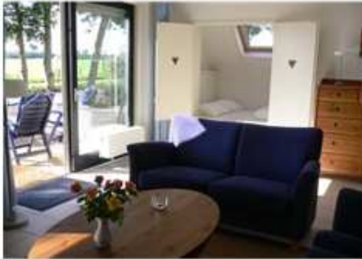
Wohnzimmer mit Alkoven