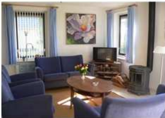
Wohnzimmer mit Holzofen