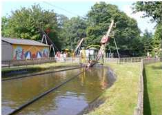
Vergnügungspark in Rijs