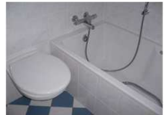
Badezimmer mit Wanne, WC und Waschtisch