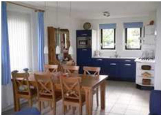
Küche mit Geschirrspülmaschine