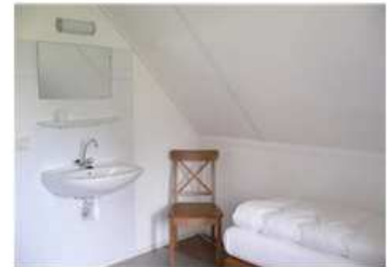
Vorderes Schlafzimmer mit Waschbecken