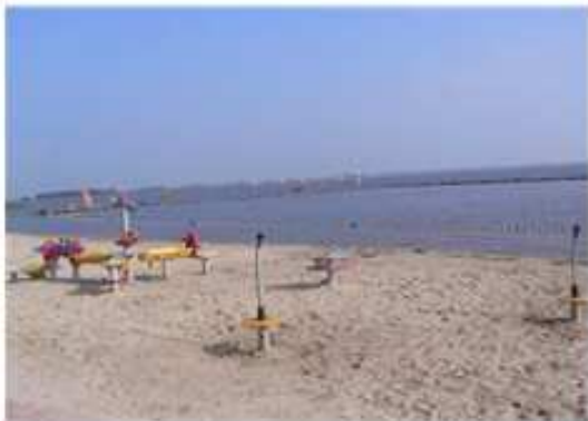
Strand „Hege Gerzen“