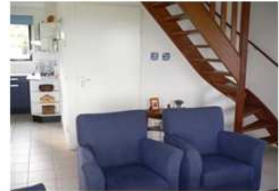
Offene Treppe zum Obergeschoss

Von der exklusiven Ferienvilla aus hat man Blick auf den angrenzenden Radwanderweg zum Gaasterlander Wald mit zahlreichen Möglichkeiten zum Wandern und Radfahren. Die Qualität der Freizeitangebote und die einmalige Natur sind kennzeichnend für die Region, die von den Einheimischen als das „schönste Fleckchen“ von Gaasterland bezeichnet wird. Der Radweg unmittelbar am Park hat Verbindungen zu anderen Radwanderwegen und -routen. Der Park ist auch eine gute Ausfallbasis für die Elf-Städte-Tour mit dem Fahrrad. Die prachtvolle Umgebung mit viel Wald und zahlreichen Seen, die Ruhe und die günstige Verbindung zum IJsselmeer und dem Strand „Hege Gerzen“ (mit Sandstrand und Sanitäranlagen) locken zu schönen Ausflügen. Zu den Parkeinrichtungen gehören eine Minigolfanlage, ein Fußball- und Volleyballplatz, Spielgeräte und ein kleines Restaurant. Der Vergnügungspark „Het Sybrandy Ontspanningspark“ in Rijs sorgt für die nötige Abwechslung für Familien mit Kindern.